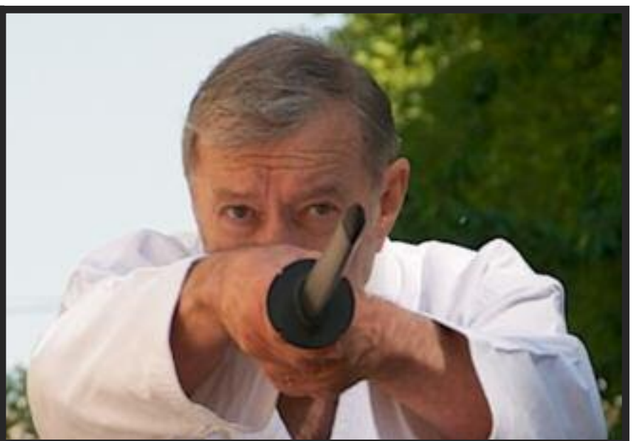
Quelle que soit l'arme que tient la main, la gestuelle est habitée de l'esprit martial de Ki-haku (extension de l'énergie) ou Ki-seme (menace avec l'énergie).